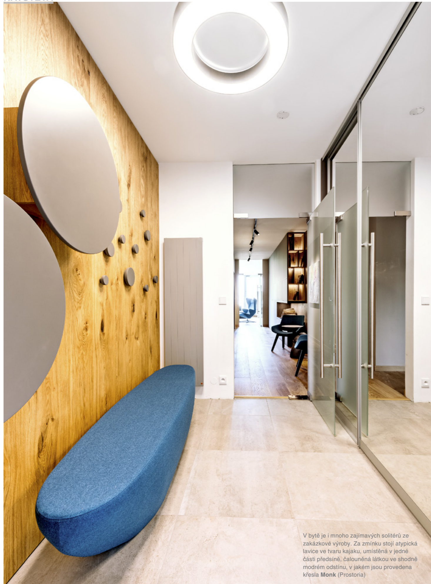
V bytě je i mnoho zajímavých solitérů ze zakázkové výroby. Za zmínku stojí atypická lavice ve tvaru kajaku, umístěná v jedné části předsíně, čalouněná látkou ve shodně modrém odstínu, v jakém jsou provedena křesla Monk (Prostoria)