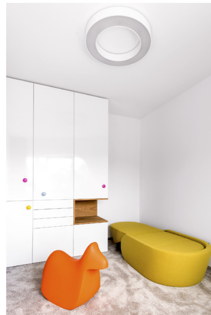
▲ Dětské pokoje majitelé a rodiče dvojčat oživilo plastovými doplňky od italského výrobce Plust