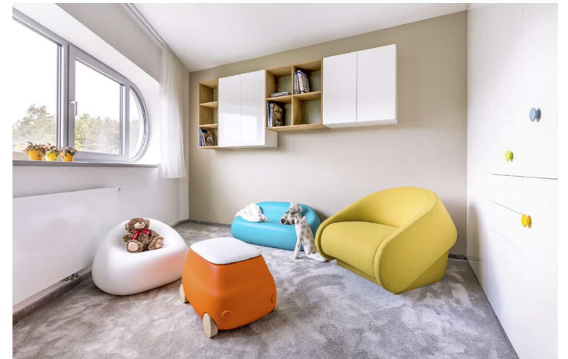
► Do jednoho z dětských pokojů majitelé umístili žluté rozkládací křeslo Up-Lift, za jehož jednoduchý rozkládací mechanismus a estetické pojetí v jednom designě značky Prostoria obdrželi světové ocenění Red Dot Design Award